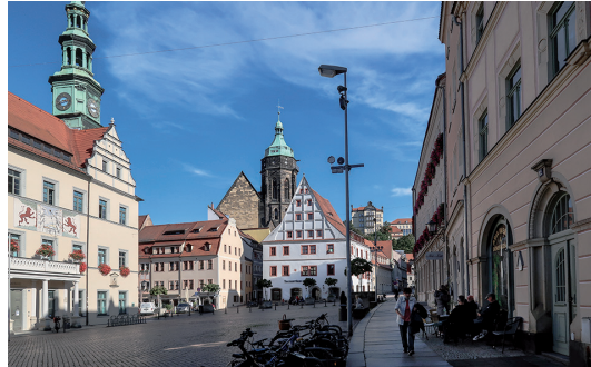
Pirna Marktplatz und Rathaus

Nach 3 Tagen Naturgenuss war Kultur angesagt. Ein Stadtrundgang durch Pirna mit sachkundiger Führung war willkommene Erholung von den Mühen der ersten 3 Tage. Ja, die Kraft lässt nach und so bin ich, und nicht nur ich, den Rest der Wanderwoche eigene bequemere Wege gegangen. Auf die Festung Königstein kommt man ja jetzt vom