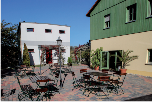
Terrasse am NaturFreundeHaus