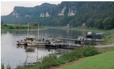
Fähre in Rathen

Die erste Tour immer an der Elbe entlang nach Rathen haben noch alle geschafft. Es ging ja auch immer stromabwärts. In Rathen suchte sich jeder sein Zusatzprogramm, entweder auf die Bastei oder gemütlich zum Amselsee oder ins Cafe. Der zweite Tag versprach schon anspruchsvoller zu werden. Der Königsplatz bei Hinterhermsdorf (436,5 m) sollte der Höhepunkt des Tages werden. Na, wenns der Geenich da noff geschafft hat, da schaffen mir das doch allemal. Wir schaffen das!